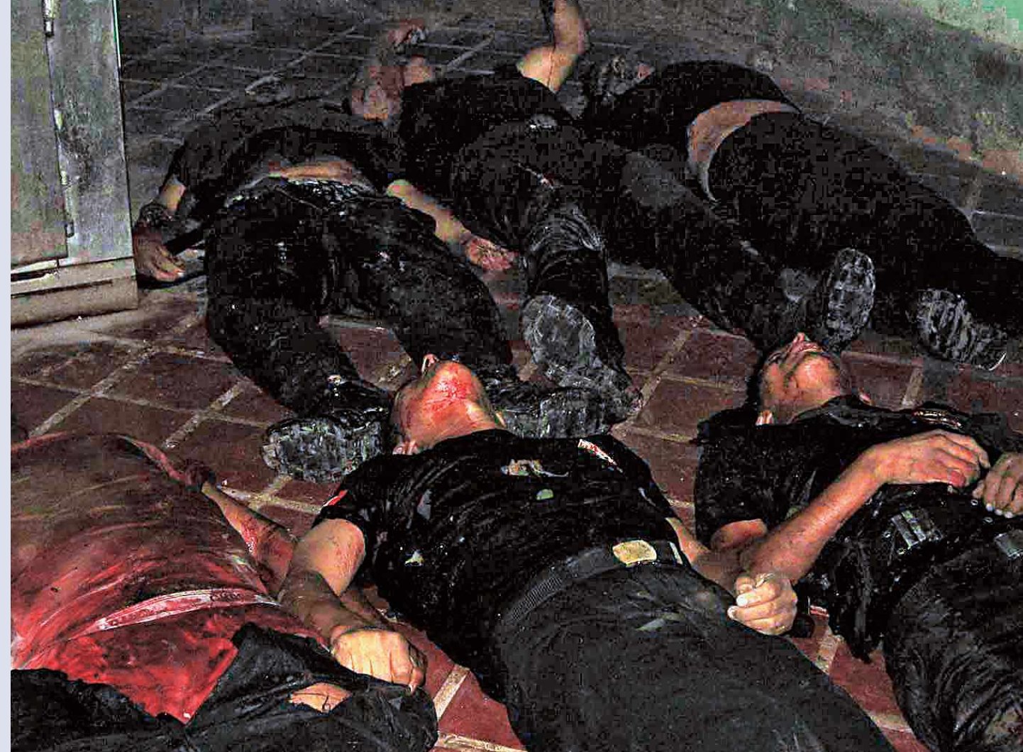
Los senderistas emboscaron a los policías con fusiles y explosivos. Los agentes se resistieron, pero fue imposible sobrevivir al ataque.

A las 3:30 de la tarde, el panorama en el lugar era desolador: una bandera con la hoz y el martillo fue encontrada entre los cuerpos. Los subversivos se llevaron los fusiles