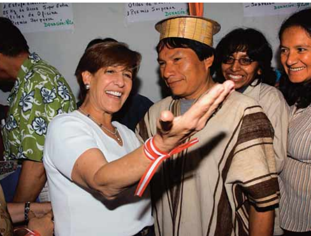
Susana Villarán encabeza una de tres planchas de izquierda. A la derecha, Ulises Humala prometió procesar por traición a la patria a cúpula montesinista para llevarla al paredón.