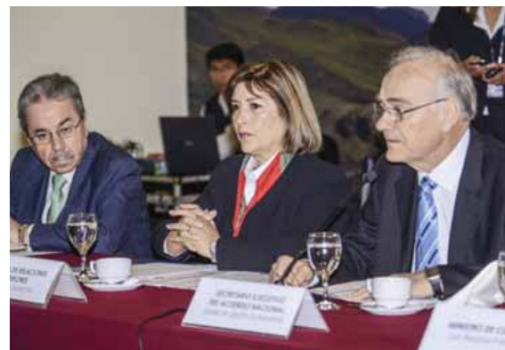
Canciller Rivas en el Acuerdo Nacional.

“Comprometer nuestro honesto, leal y efectivo acatamiento a la resolución que adopte la Corte de La Haya”.