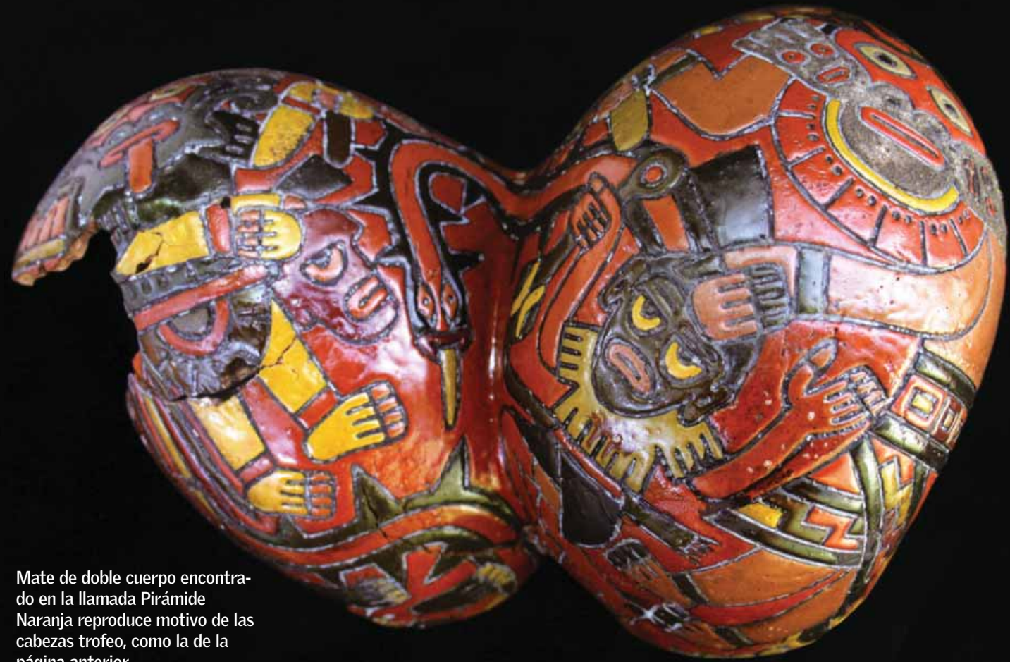
Mate de doble cuerpo encontrado en la llamada Pirámide Naranja reproduce motivo de las cabezas trofeo, como la de la página anterior.

• Nazca y su construcción habría sido iniciada hace casi dos mil años. Su esplendor lo vivió entre el 400 a.C. y el 400 d.C.