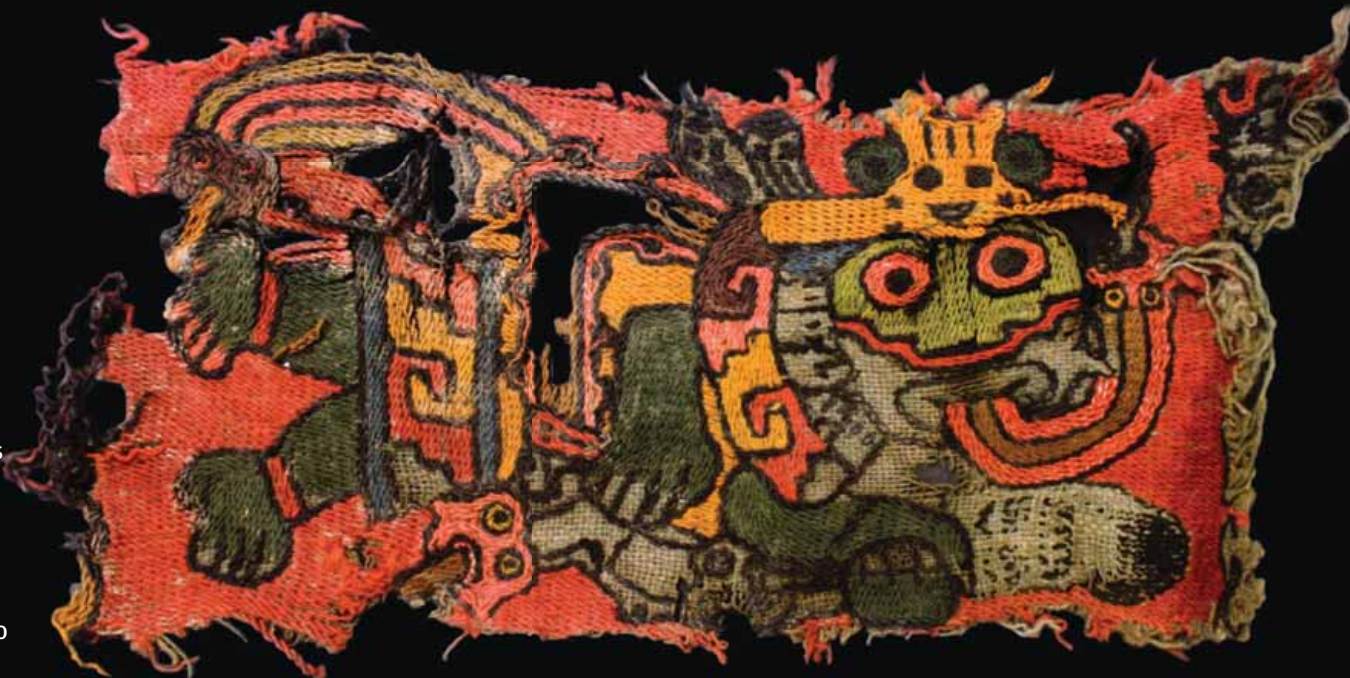
Bordado fue la técnica ornamental más utilizada en los textiles. Precisión y variedad de los puntos se explicaría en uso de telares.

durante siglos y al mismo tiempo desarrollaron los trabajos de restauración de construcciones, como las dos grandes pirámides, con la segunda elevada a casi 50 metros sobre el nivel del río Nazca, y el Templo Escalonado. Los libros también revelan los tesoros textiles, cerámicos y humanos cosechados