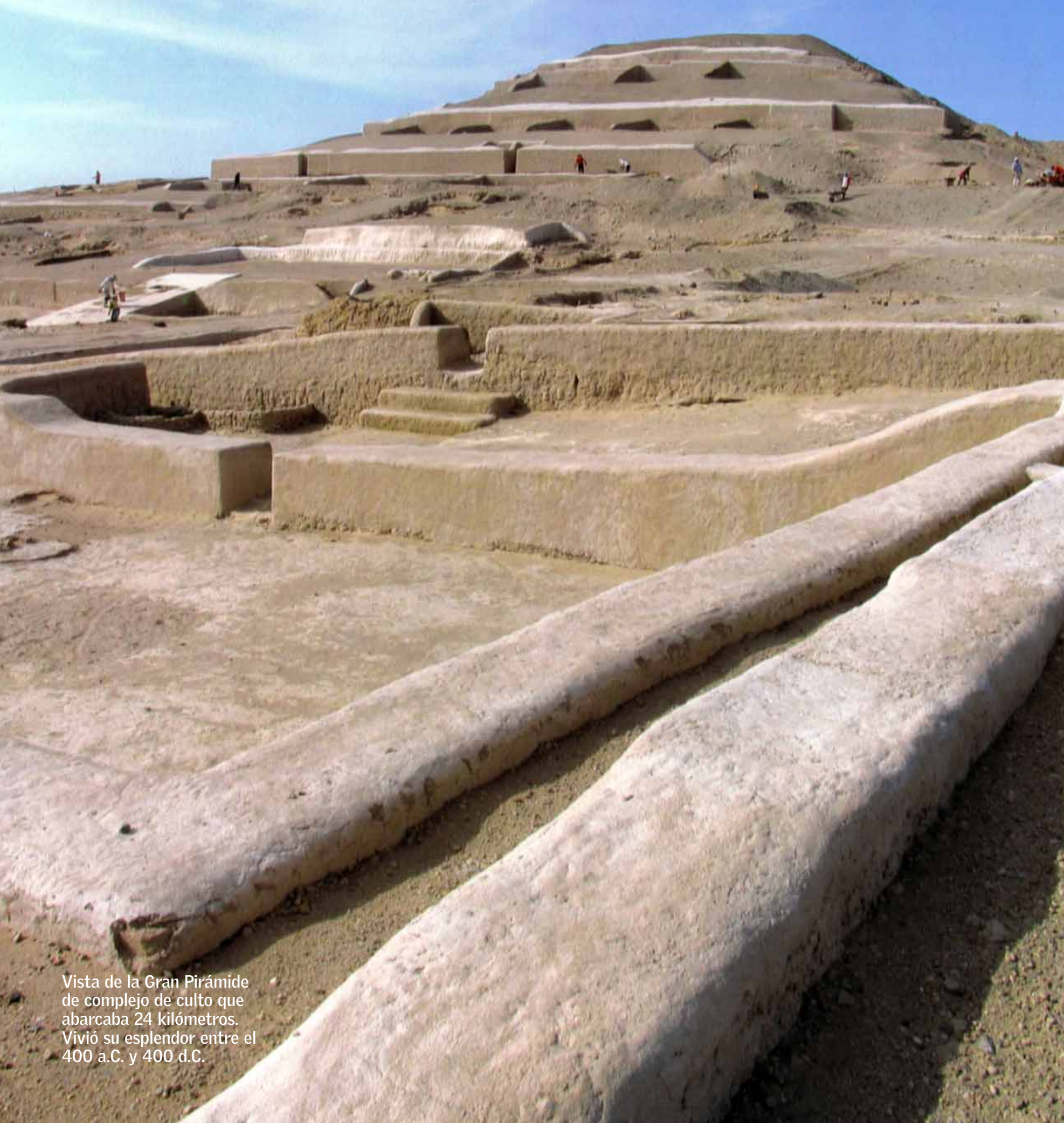
Vista de la Gran Pirámide de complejo de culto que abarcaba 24 kilómetros. Vivió su esplendor entre el 400 a.C. y 400 d.C.