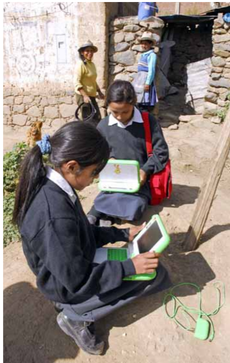
El reparto de laptops debe continuar.

La nueva Ley de Carrera Magisterial condiciona el ascenso y salario de