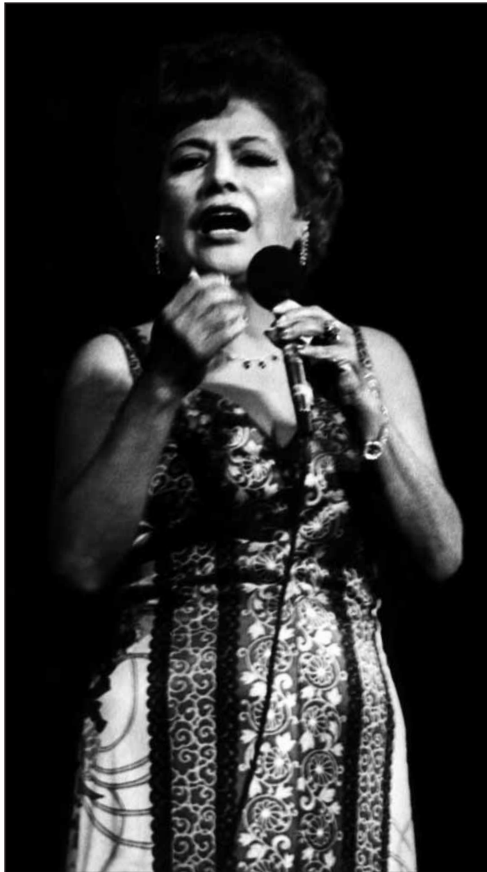
Jesús Vásquez, reina y señora de la canción criolla: cesó su canto.