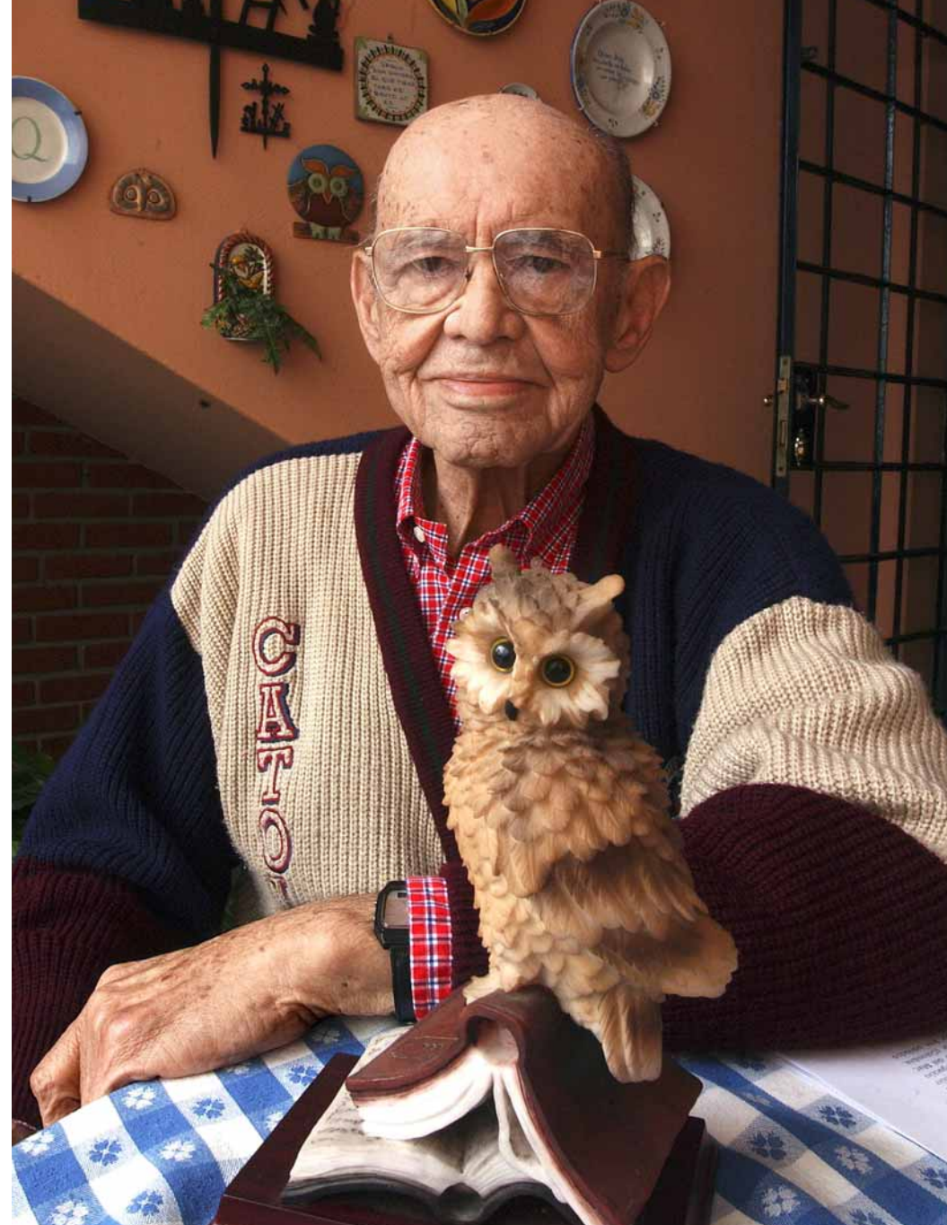
Juan Miguel Bákula, uno de los grandes intelectuales peruanos de los últimos tiempos.