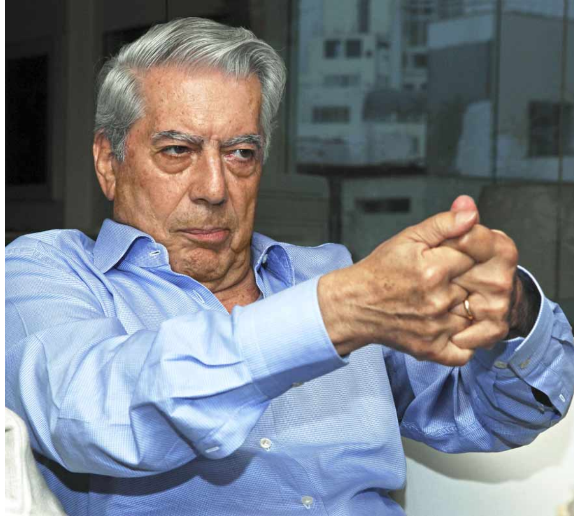
"El 50% de los peruanos no creen en la democracia y los que creen lo hacen a regañadientes".

turas generaciones, diría sobre todo los jóvenes, se enfrenten a su pasado de una manera creativa. Al mismo tiempo que sirva como lugar de investigación, de estudio y de reflexión. Hoy en día la tecnología audiovisual extraordinaria nos puede permitir, ahora que todavía estamos tan cerca de los acontecimientos, construir un gran archivo que permita investigar de una manera científica por qué ocurrió, cómo ocurrió y qué consecuencias tuvo. De ahí se puede sacar una lección muy positiva y convencer a la gente de una manera febril de que el camino no pueden ser ni las bombas, ni los secuestros,