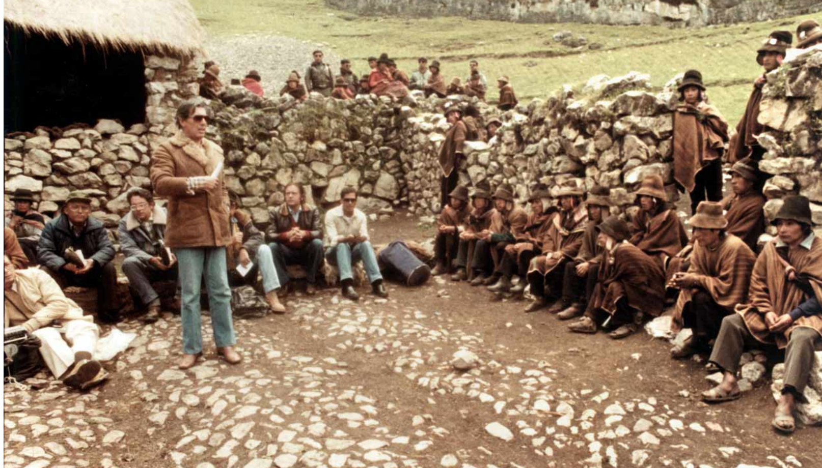
La Comisión Uchuraccay "me cambió la vida, me hizo conocer un nivel de barbarie del que yo no era consciente, que se hubiera podido llegar a una cosa tan atroz".

—Lo lamento. Muchos estuvieron conmigo porque parecían identificados con mis convicciones democráticas. Durante el régimen de Fujimori, Rafael Rey me sorprendió mucho. Lo diré con toda franqueza: yo tenía mucho afecto por él, era muy joven, parecía muy pu-