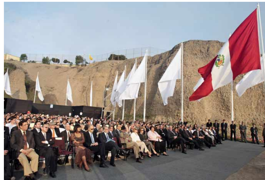
Ceremonia de entrega del terreno en Miraflores se realizó el miércoles 16.

tecimientos, construir un gran archivo que permita investigar de una manera científica por qué ocurrió, cómo ocurrió y qué consecuencias tuvo. De ahí se puede sacar una lección muy positiva y convencer a la gente de una manera febril de que el camino no pueden ser ni las bombas, ni los secuestros,