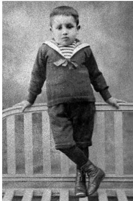
Jiménez Borja vivió desde niño la explosión de color de las fiestas populares en el Ande.

En la arqueología tuvo virtudes y desaciertos, pero no se debe juzgar a Jiménez con los ojos contemporáneos, su compromiso con el país está