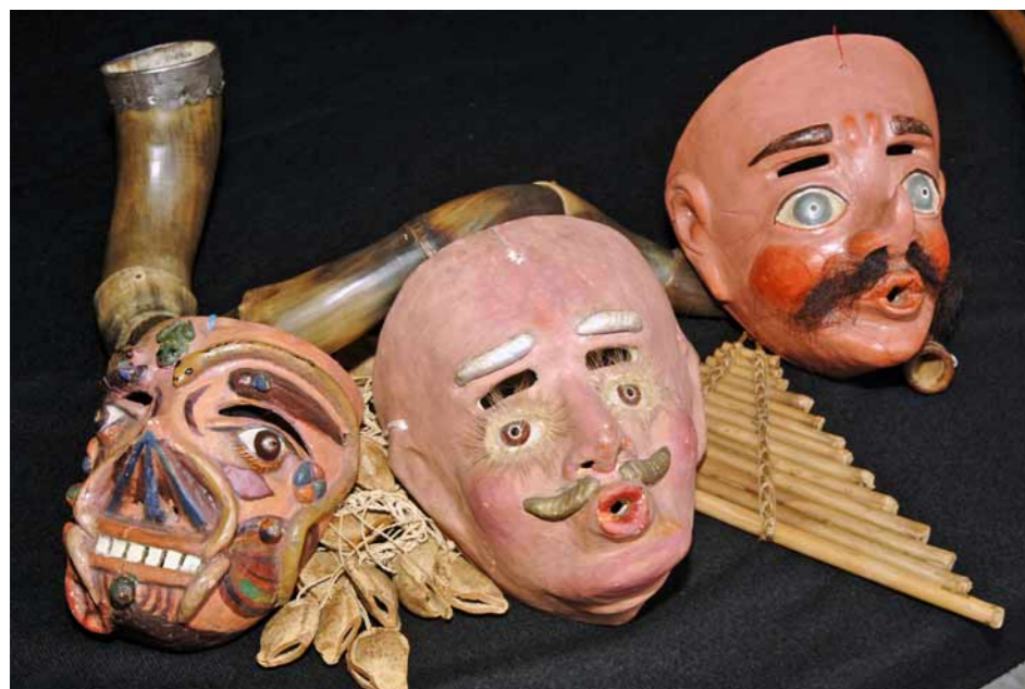
La colección de máscaras consta de 237 ejemplares a disposición de los investigadores.

dad de José Sabogal y sus discípulos que interpretaron el Perú desde esta corriente intelectual que no era exclusiva de nuestro país, ya que simultáneamente se vivía también en México, Brasil, Argentina y Bolivia. ■